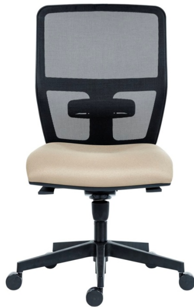
Со средней спинкой