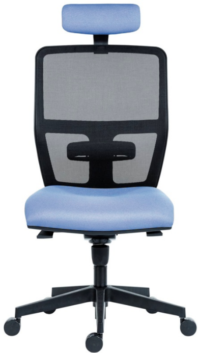
С высокой спинкой